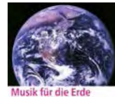
Musik für die Erde

19.10., Sa 18.00 – 21.00 Uhr Musik für die Erde: „...dass die Erde Stern will werden“ 18.00 Uhr Vortrag von Karsten Massei 20.00 Uhr Konzert „Die tanzende Sonne“ mit Werken von Sofia Gubaidulina u. a. Mensch Musik Hamburg