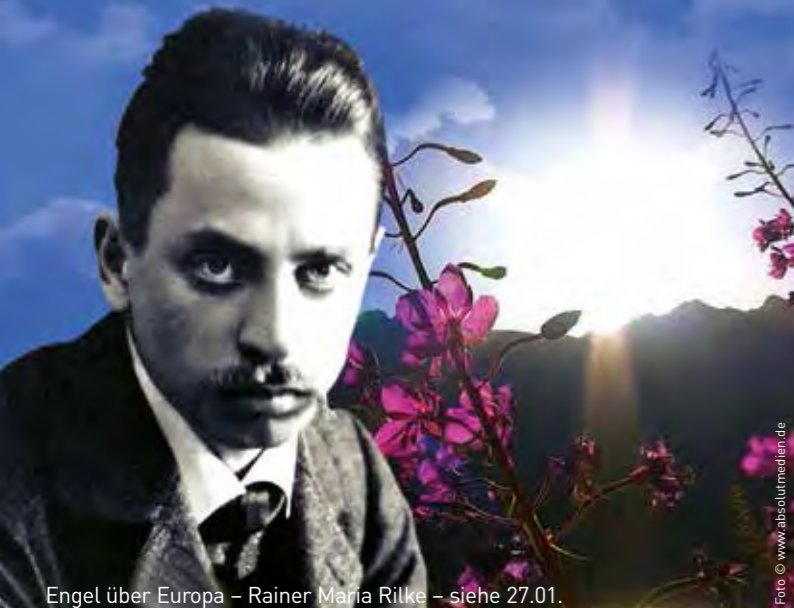
Engel über Europa – Rainer Maria Rilke – siehe 27.01.